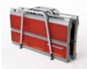
Zwei Barelemente als Flightcase ...

Die Bar besticht vor allem durch den niedrigen Manipulationsaufwand. Dies wirkt sich sowohl auf die Transport- als auch Auf- und Abbaukosten aus. Kompaktheit und die Berücksichtigung von Gastronomie- und TÜV-Normen garantieren reibungsloses und sicheres Arbeiten.