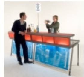
... in 5 Minuten einsatzbereit.